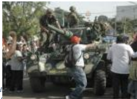
Honduras. Reporte de violaciones a los derechos humanos después del golpe de estado político-militar CIPRODEH

A raíz del golpe de Estado todos los días el movimiento social de resistencia al golpe de Estado desarrolla marchas pacíficas en distintas ciudades del país. En al menos siete de de esas manifestaciones populares se han desarrollado acciones violentas y de uso abusivo de la fuerza